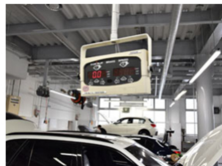
スキルアップで効率とミス撲滅

ただ闇雲に“残業を減らせ”では、お客様と現場のスタッフに負担がかかってしまいます。光洋自動車では、効率よく迅速にサービスをご提供できる体制を整えています。