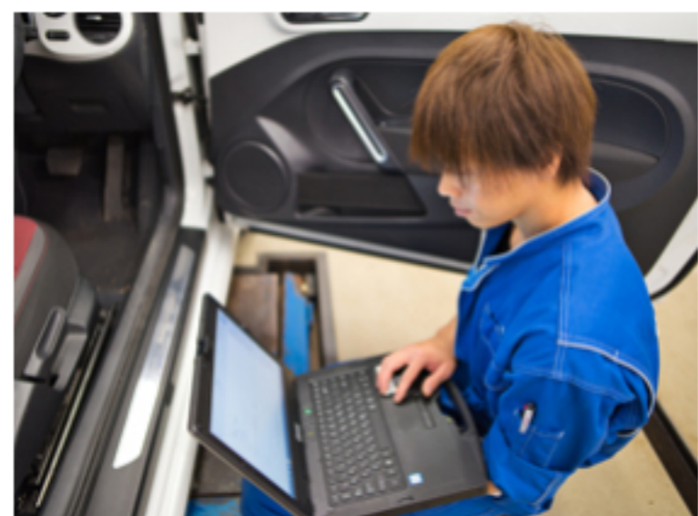
ツールの活用で迅速な診断