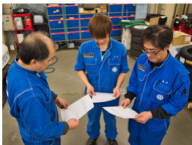
密なコミュニケーション